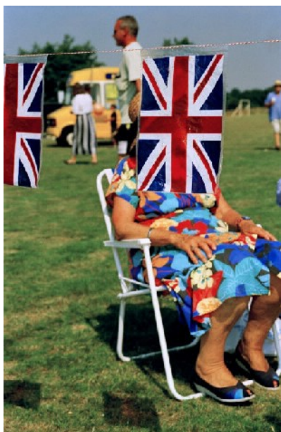
England. Sedlescombe. 2000