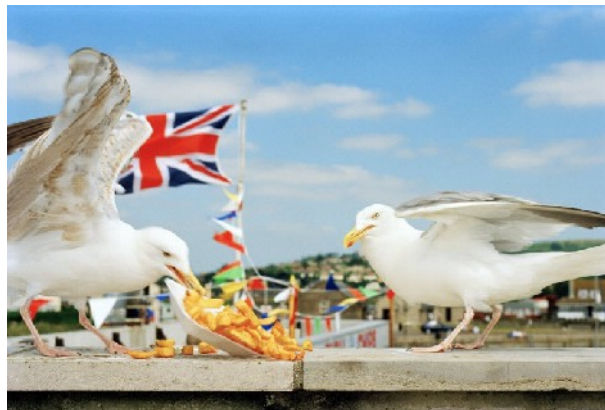
© Martin Parr, England. West Bay. 1996. Courtesy Magnum Photos