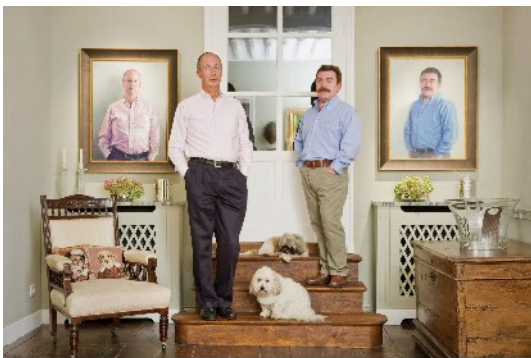
© Rip Hopkins Série Another Country Jardins aux Vergers Courtesy Galerie Le Héveraire - Lyon

Rip HOPKINS « Another country - les Britanniques en France »