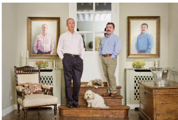
© Rip Hopkins Série Another Country "Jamais d'une fois" Courtesy Galerie Le Réverbère / Lyon