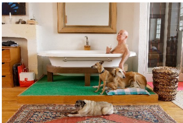
Série Another Country "Quand changez-vous les chiens?"