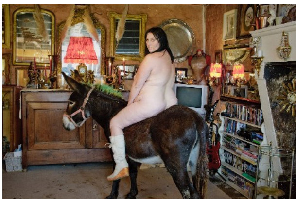
© Rip Hopkins Série Another Country "Je n'y retournerai jamais" Courtesy Galerie Le Réverbère / Lyon

© Rip Hopkins - Galerie Le Réverbère / Lyon