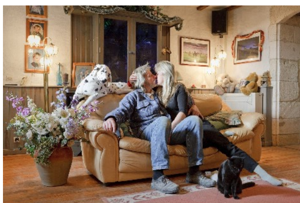
© Rip Hopkins Série Another Country "Je lui gratte le dos si il me quitte le arden" Courtesy Galerie Le Réverbère / Lyon