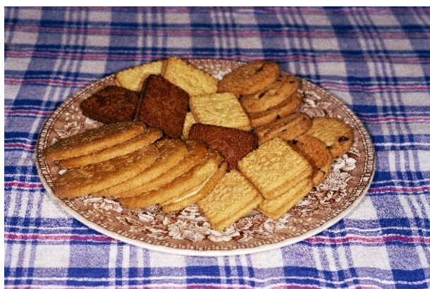
ENGLAND. Bridport. 2003.