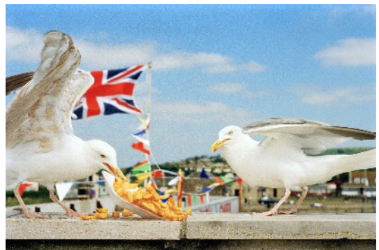
© Martin Parr, England, Sedlescombe, 2000. Courtesy Magnum Photos